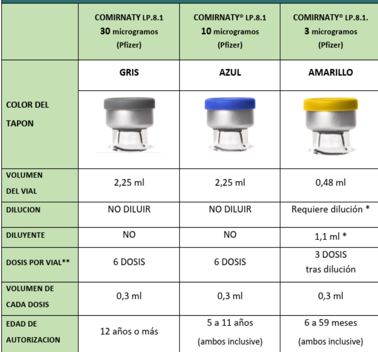
TABLA 7. Diferencias principales entre las presentaciones de las vacunas disponibles frente a COVID-19. Andalucía, campaña 2025-26.