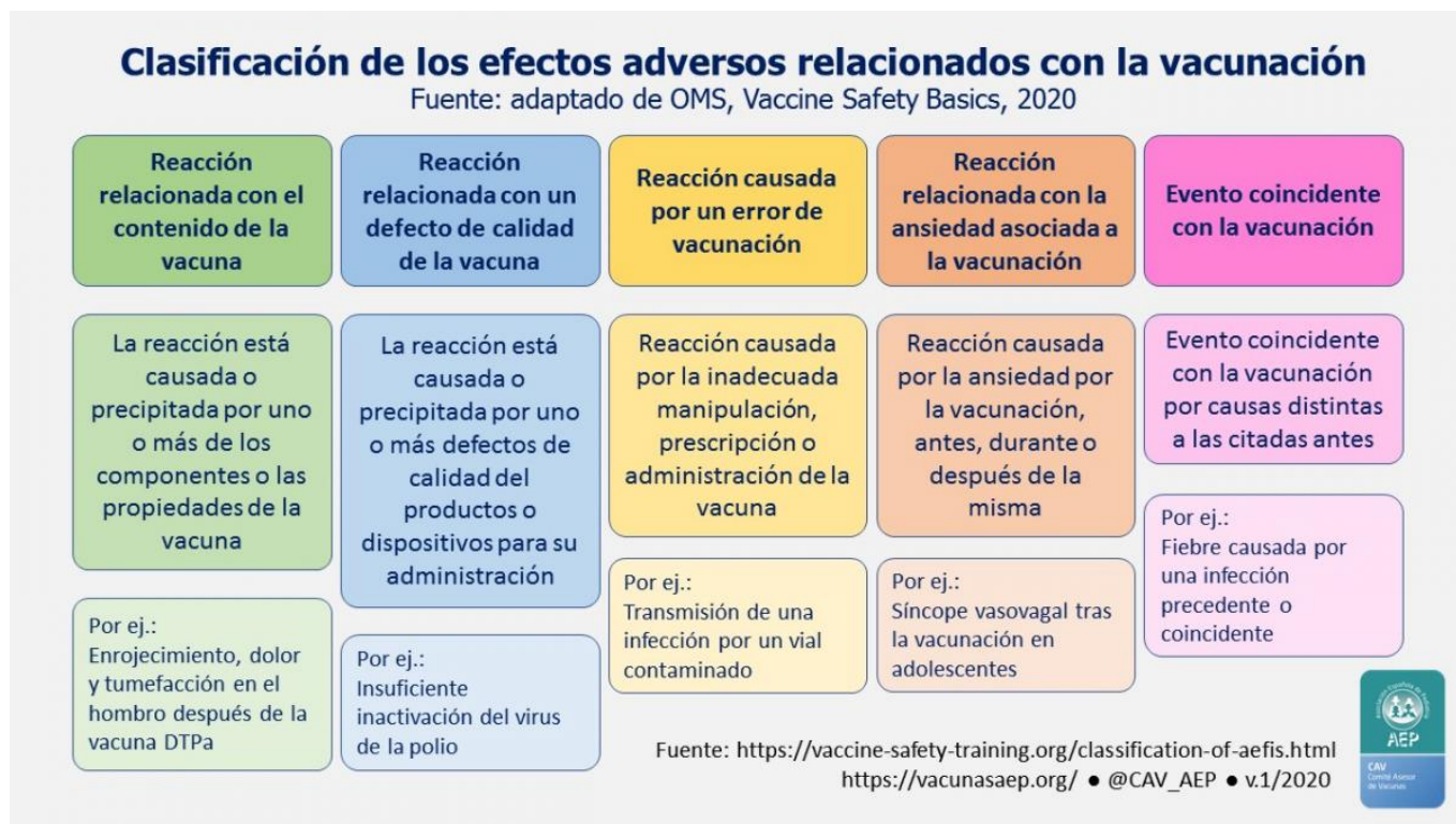
Figura 3.1. Clasificación de los efectos adversos relacionados con la vacunación. (OMS*)

* Modificado de WHO E-learning course on Vaccine Safety Basics .